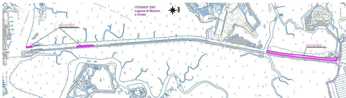
Estratto della CTRN con evidenza sommaria dei tratti del Canale Belvedere interessati dal dragaggio in punti specifici (evidenziati in viola).

si riportano di seguito viste aeree e stralci degli elaborati progettuali a definizione ed inquadramento delle aree d'intervento. Per comodità di lettura, alcuni degli elementi grafico-illustrativi vengono ritratti in grande formato nelle pagine successive.