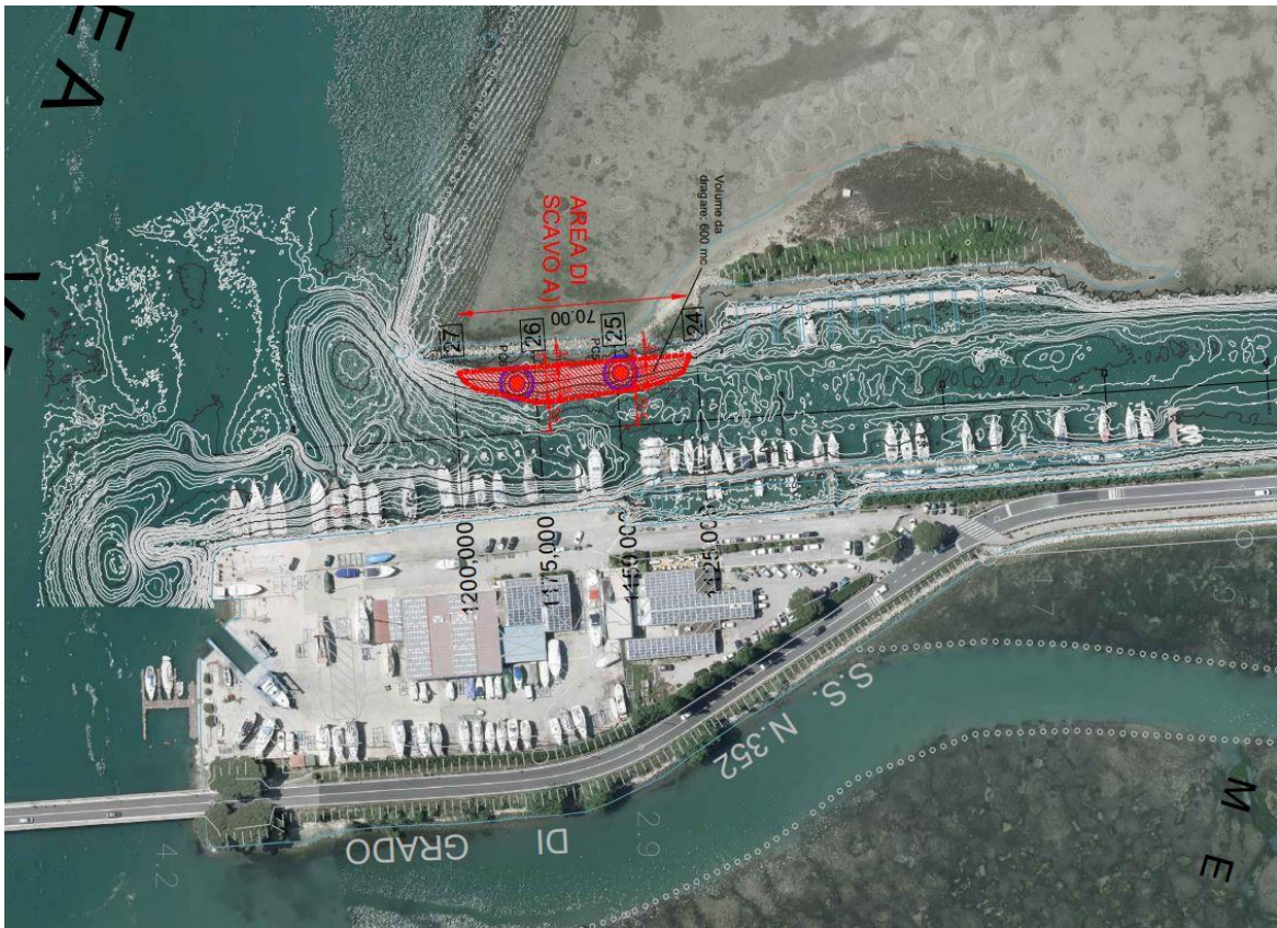
Tratto a SUD del Canale Belvedere, con area oggetto di dragaggio campita con tratteggio rosso (ed in zona prossima alla Darsena San Marco).