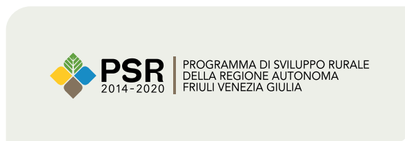
Fondo tinta chiara

Il logotipo nella versione in negativo forato bianco è da preferirsi quando deve essere usato su sfondi di colore nero o colorati e su illustrazioni e sfondi fotografici di colore uniforme.