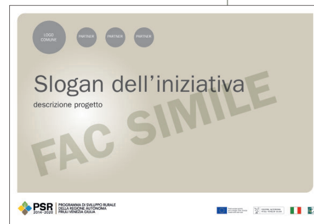
Esempio di comunicazione orizzontale

Spazio dedicato alla grafica del beneficiario