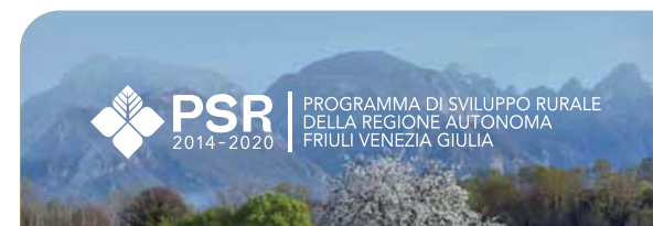
Fondo con immagine