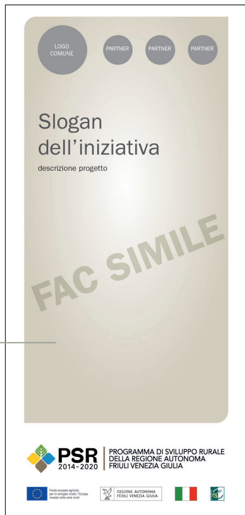
Esempio di copertina leaflet

Spazio dedicato alla grafica del beneficiario