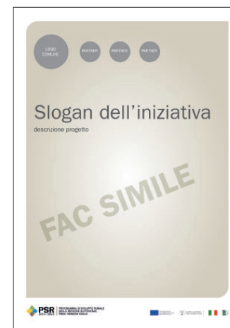
Esempio di comunicazione verticale

Spazio dedicato alla grafica del beneficiario