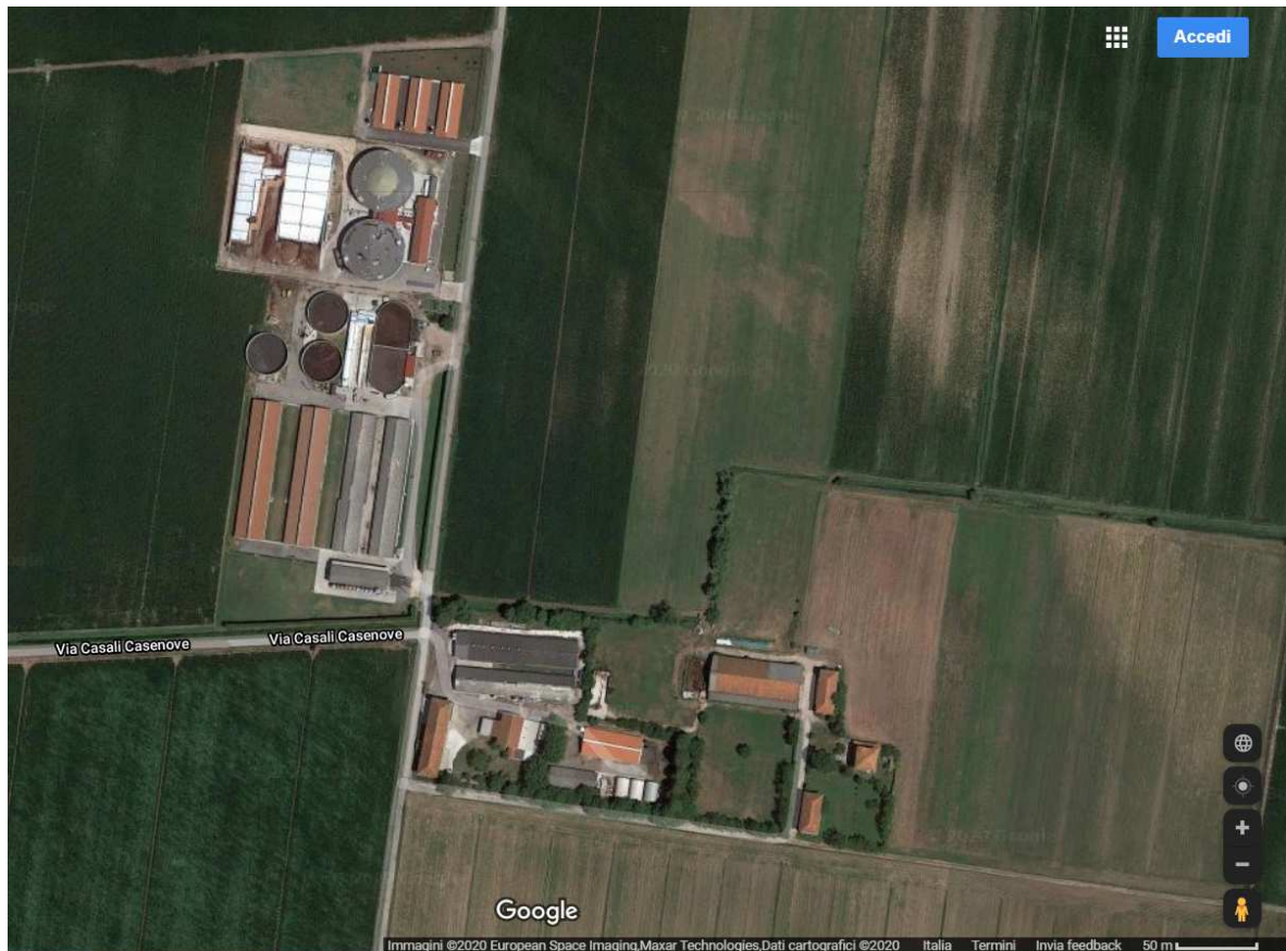
Figura 2: fotografia aerea dell'allevamento.