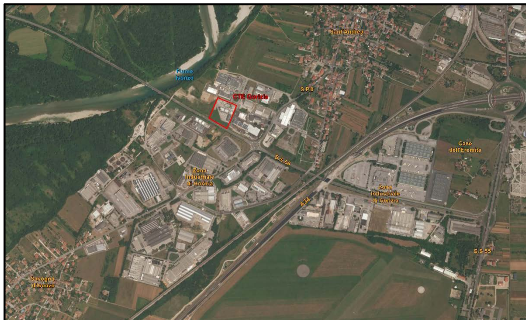
Figura 1a Localizzazione CTE