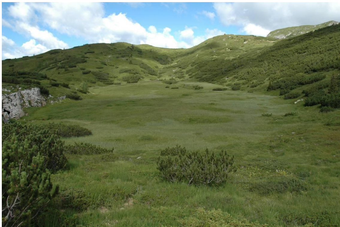
Torbiera presso Val dolce. Sulla destra la grotta di Attila