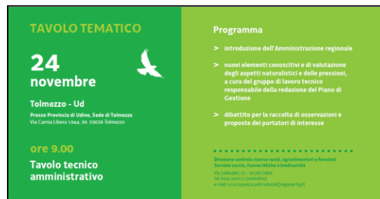
Retro invito tavolo amministrativo