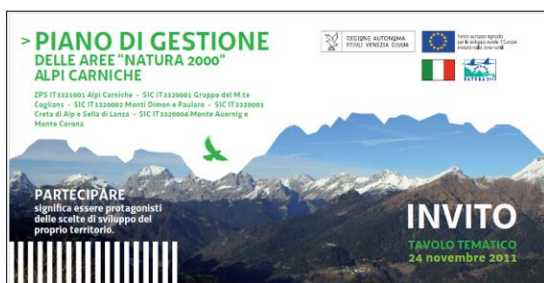
Fronte dell'invito del 24 novembre

Ad ogni singolo portatore di interessi è stato inviato un invito ai tavoli tematici mediante una e-mail o mediante posta ordinaria quando non muniti di un indirizzo di posta elettronica. Sono stati realizzati tanti inviti quanti erano i tavoli, di seguito a titolo esemplificativo riportiamo uno degli inviti, poiché l'impostazione grafica era la medesima per tutti.