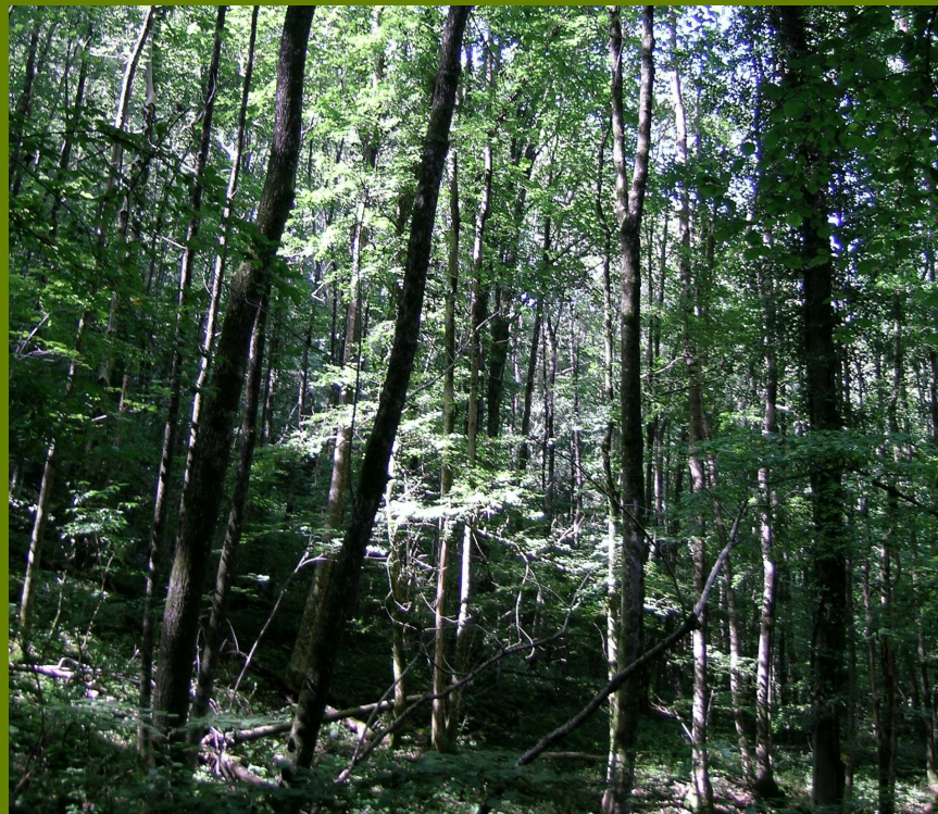
Habitat 9180 Foreste di versanti, ghiaioni e valloni del Tilio-Acerion