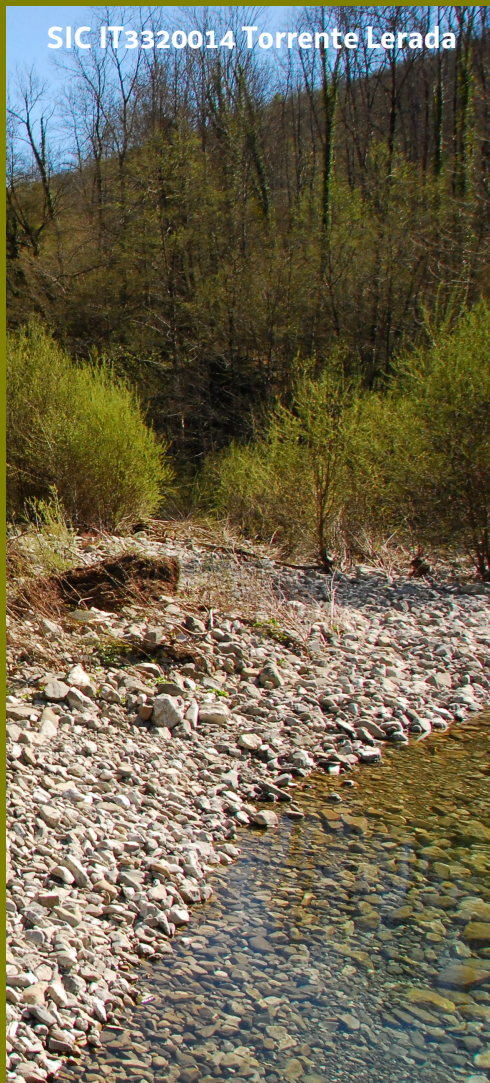
SIC IT3320014 Torrente Lerada