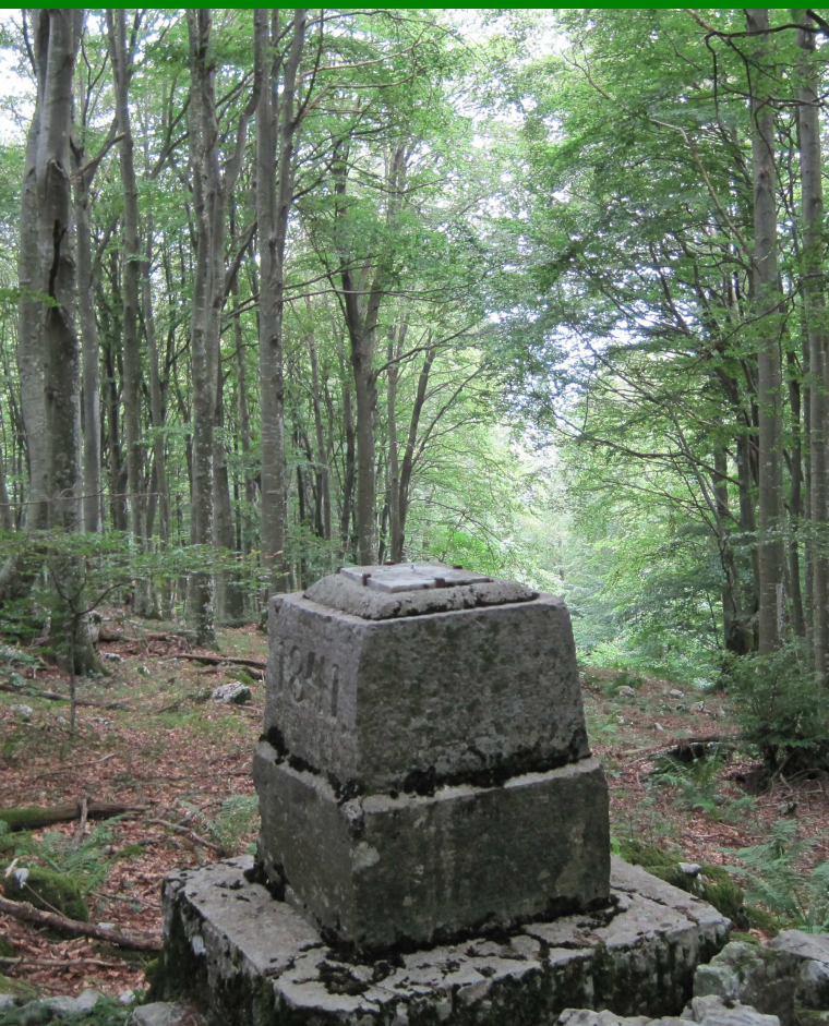
Cippo di confine

L'Unione europea permette l'utilizzo dei fondi agricoli e strutturali nelle aree della Rete Natura 2000 solamente a fronte di Misure di Conservazione sito-specifiche o di Piani di Gestione approvati dagli organi competenti.