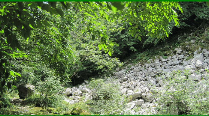
Habitat 9180 Foreste di Tilio-Acerion