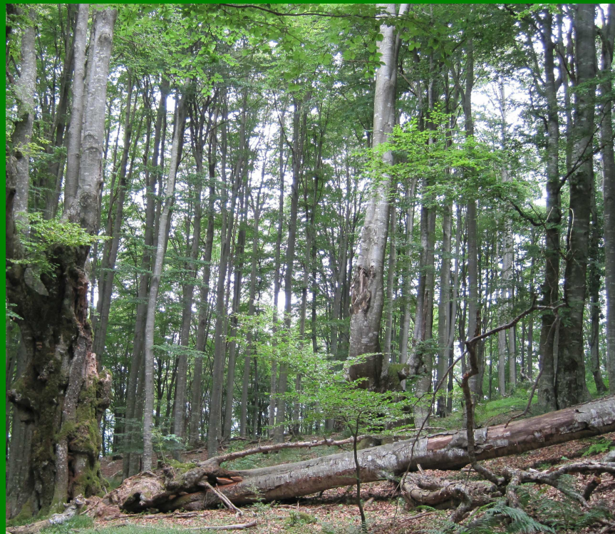
Habitat 91K0 Foreste illiriche di Faggio ( Fagus sylvatica )