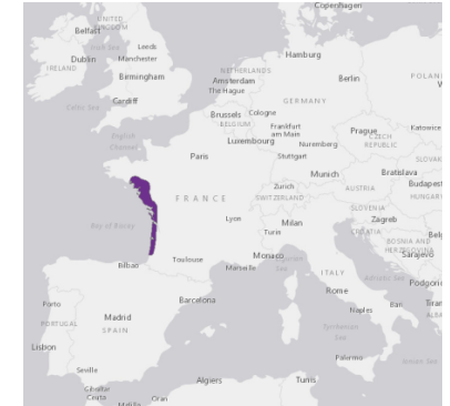
Areale di introduzione