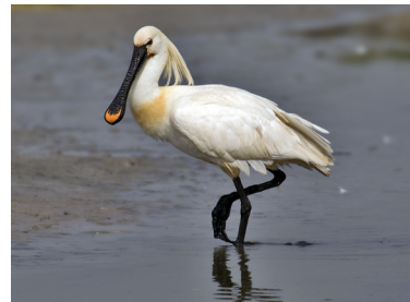
Spatola Platalea leucordia