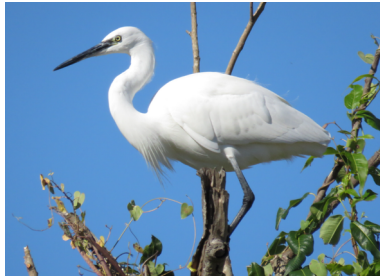
Garzetta Egretta garzetta