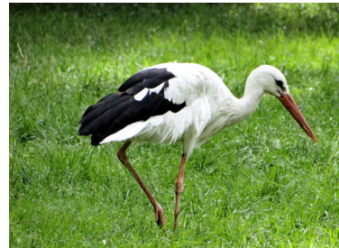
Cicogna Ciconia ciconia

Non confondibile con altre specie, ma, in condizioni di poca luce o a notevole distanza, possibile confusione con altre specie per via della colorazione e silhouette (spatola, mignattaio, garzetta, cicogna).