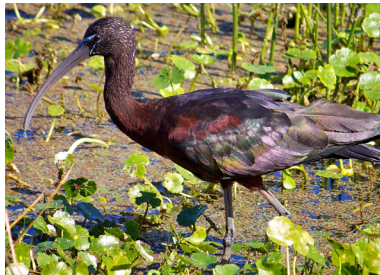
Mignattaio Plegadis falcinellus