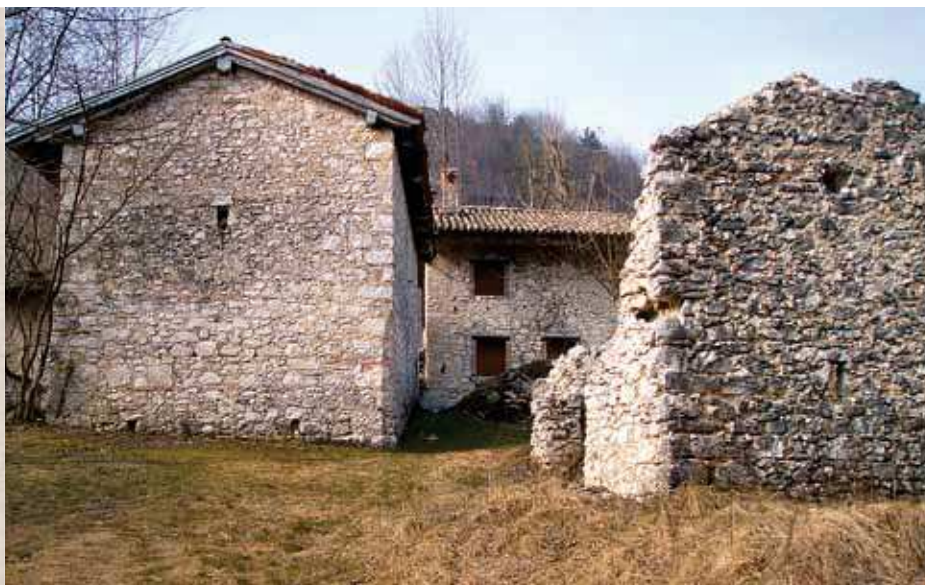
▲ Gli stavoli